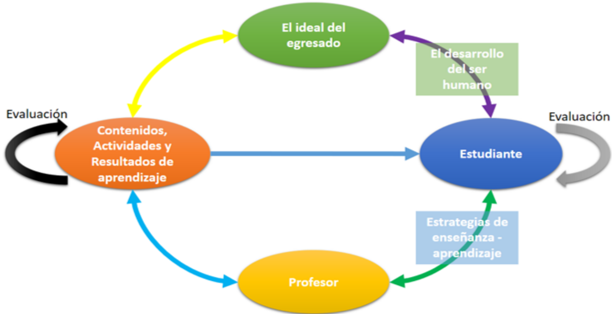
Figura 6. MODELO PEDAGÓGICO